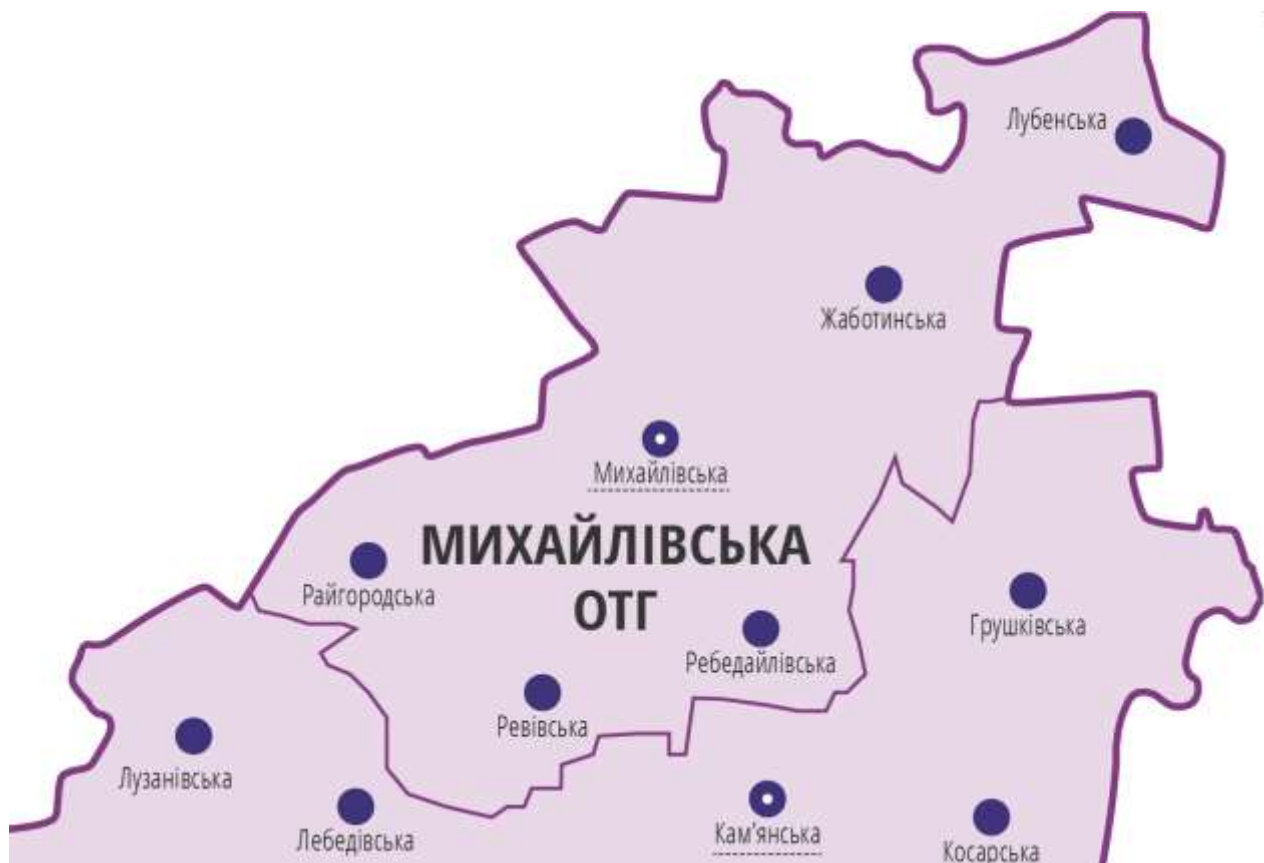
Малюнок 1.Карта Михайлівської сільської територіальної громади