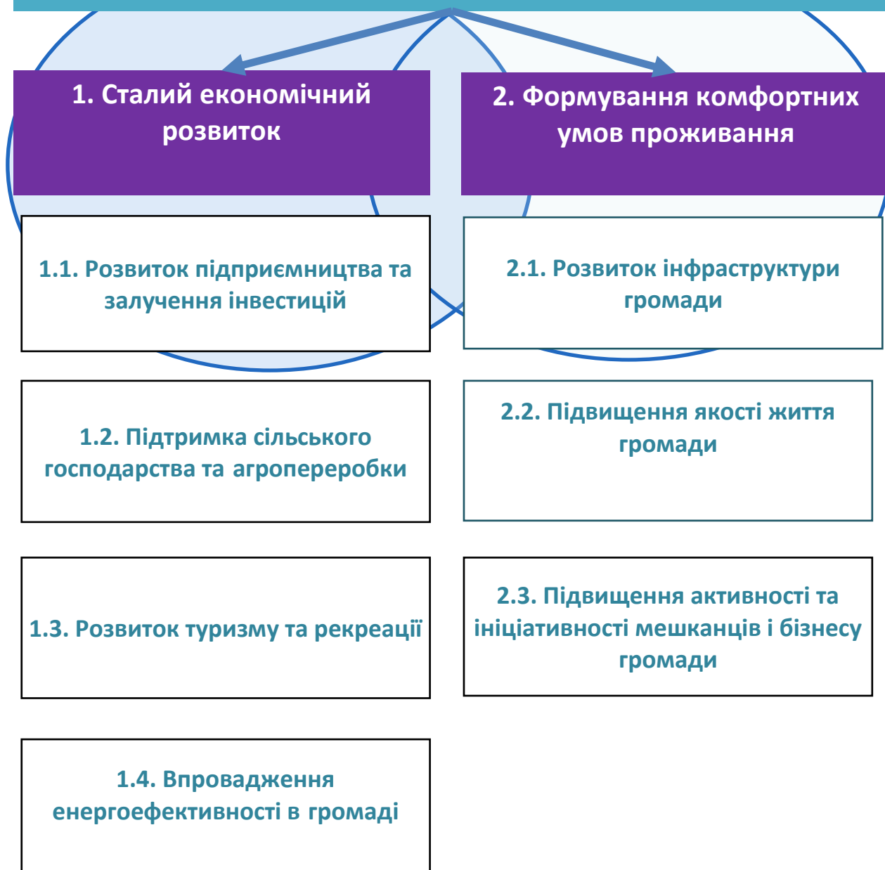
Малюнок 2 Стратегічне бачення, стратегічні та операційні цілі

Михайлівська територіальна громада - культурна, історична, аграрна та рекреаційна громада, розташована на березі річки Тясмин, вздовж автомобільної дороги Н01. Ініціативне та працююче населення і дієва місцева влада забезпечили можливості для самореалізації та розвитку підприємництва, аграрного і переробного бізнесу, туризму та досягнення європейських стандартів життя. Природа наділила громаду корисними копалинами і природно-рекреаційними зонами. Стародавні, могутні ліси та екологічно чисті водойми сформували умови для відпочинку і відтворення населення, збереження культурної та духовної спадщини краю.